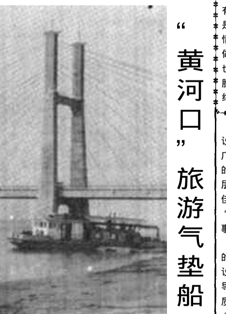
“黄河口”旅游气垫船开航 本报讯 由垦利县土地局、旅游公司投资，天津大沽造船厂设计制造的“黄河口”豪华旅游气垫船，8月18日正式开航。该船开航是垦利县旅游业推出的又一个较大旅游项目，该船一次可乘坐33位旅客游览黄河口风光，具有安全、舒适、平稳的特点，它是继丹东、郑州之后的又一大型气垫船。市、油田及垦利县的领导参加了开航仪式。上图为豪华气垫船（左）。