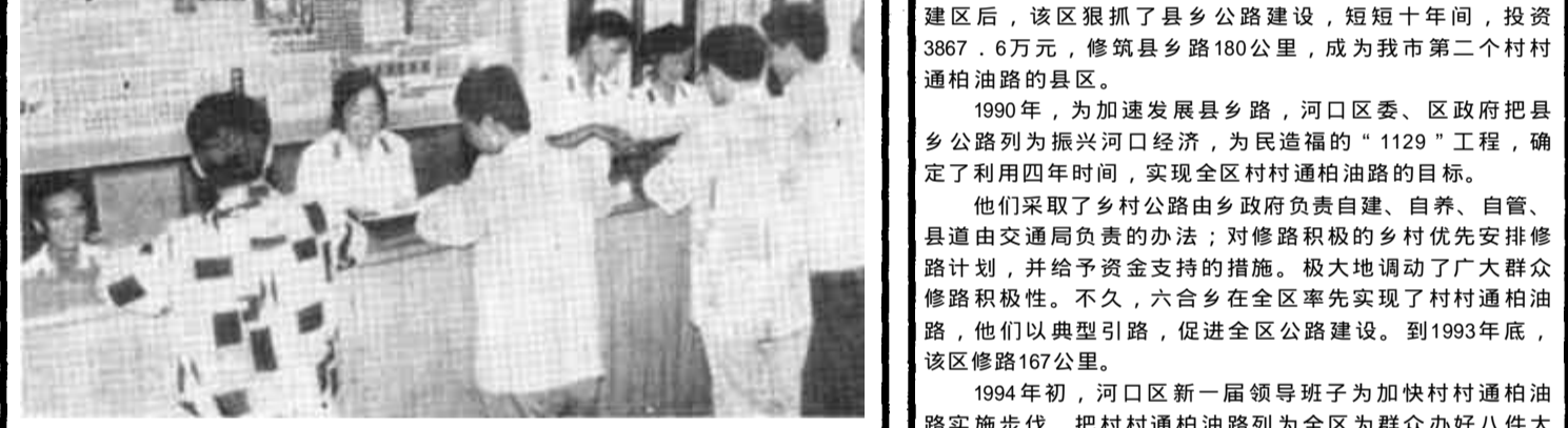
这里是区交通局规费征收和证件办理的集中场所。在这里，业户一次就能办完所有的手续，难怪他们称这里是一条龙服务。

河口区交通局把优质服务放在首位。征收人员在业余时间文明征收，礼貌待人，普通使用普通话，文明用语；做到来有迎声、问有答声、走有送声。使营运业户高兴而来，满意而归。在规费征收中，他们变过去多办为联合办公，实行初审、登记、建档、征收一条龙服务，既提高了工作效率，又方便了业户。