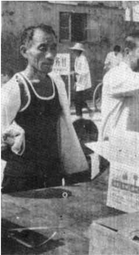
东营区供销社组织流动服务车，深入集市、村头供应农药，确保棉农及时消灭第三、四代棉铃虫。图为该社服务车正在牛庄大集供应药品。

第三，龙头企业、乡镇企业发展后劲进一步增强。1—6月份全县完成工业总产值2.79亿元，比去年同期增长71.4%，乡镇企业完成产值6.4亿元，比去年同期增长113.68%。第四，对外贸易发展较快。今年1—6月份，实现外贸出口商品收购额5435.29万元，比去年同期增长54.28%。第五，个体私营经济健康发展。从去年五月到现在，全县个体工商户就达到6105户；私营达到66家。（杨爱文）